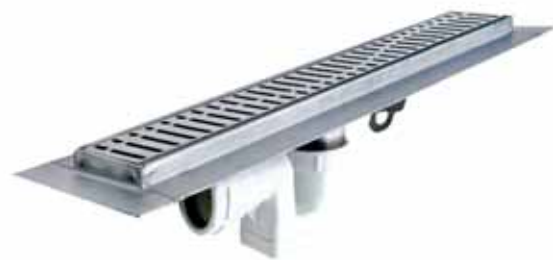
Canal Delta con alas