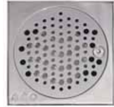
Sumidero Inox. Ocean