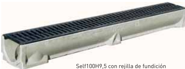
Self100H9,5 con rejilla de fundición