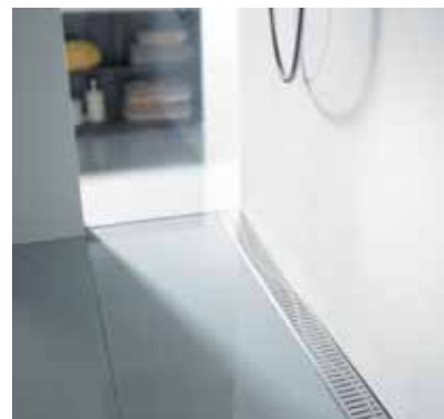
Detalle Rejilla Wave