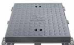
Tapa de servicio