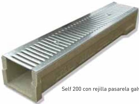
Self 200 con rejilla pasarela galvanizada